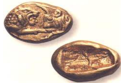
1ere Monnaie-marchandise. Hecté en or - 565 av JC. Aujourd'hui 93,2 % des transactions financières dans le monde

Tout cela semble bien beau mais comment finance-t-on le revenu d'existence face justement à cette absence de redistribution ? L'inflation n'est elle pas cachée au cœur du revenu d'existence ? N'est-ce pas là l'ancienne planche à billets ?